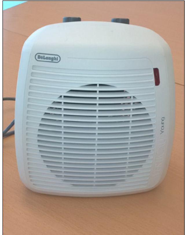
Foto van het stofschild en van een elektrisch kacheltje